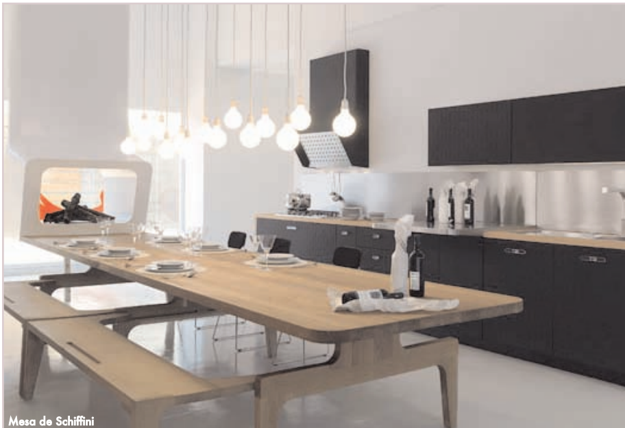
Mesa de Schiffini